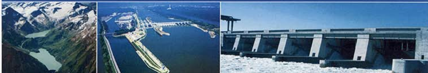
Kraftwerk Ybbs-Persenbeug: Das Laufwasserkraftwerk erzeugt im Jahr durchschnittlich 1.336 Mio. kWh bei einer maximalen Leistung von 236.500 kW.

Die Überlandwerk Fulda Aktiengesellschaft bestätigt, dass das